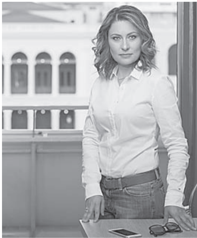
Ξεκίνησε από τη ΜΑΚΙ και τη ΔΑΠ, πέρασε στο νομαρχιακό συμβούλιο. Τώρα;

Συγγραφέας του βιβλίου για τον πολιούχο μας Απόστολο Ανδρέα